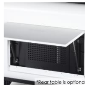
*Rear table is optional.